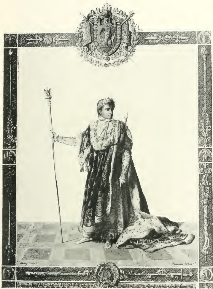
NAPOLÉON I er , DANS LE COSTUME IMPÉRIAL